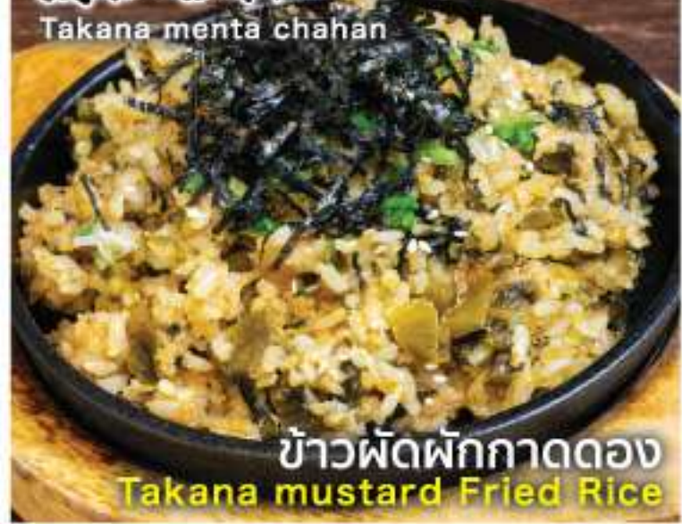
ข้าวผัดผักกาดดอง Takana mustard Fried Rice