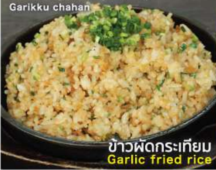
ข้าวผัดกระเทียม Garlic fried rice