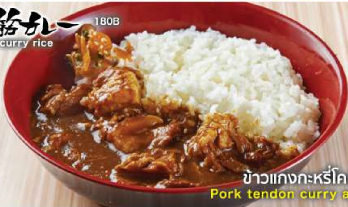
ข้าวแกงกะหรี่โคนลิ้นหมู Pork tendon curry and rice