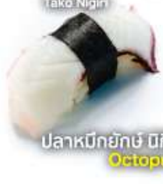
タコ握り 30B Tako Nigiri