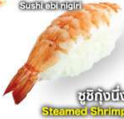
寿司エビ握り 35B Sushi ebi nigiri