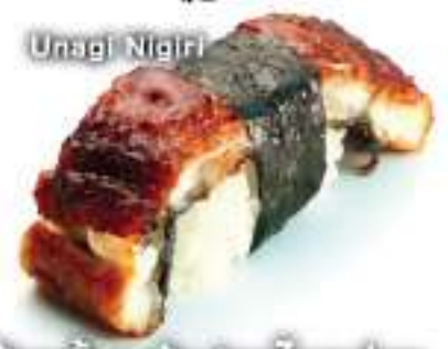
うなぎ握り 60B Unagi Nigiri