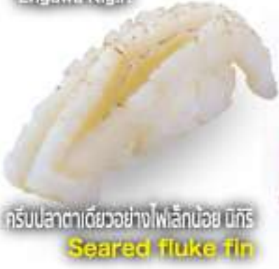
炙りエソガワ握り 45B Engawa Nigiri