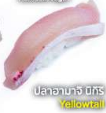
ハマチ握り 70B Hamachi Nigiri