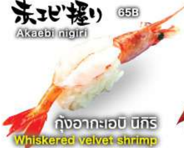
赤エビ握り 65B Akaebi nigiri