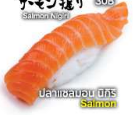
サモン握り 30B Salmon Nigiri