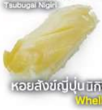
タウブガイ握り 50B Taubugai Nigiri