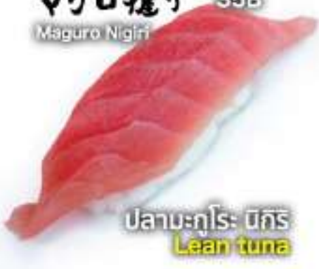
マグロ握り 35B Maguro Nigiri