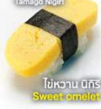
玉子握り 30B Tamago Nigiri