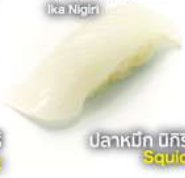
イカ握り 35B Ika Nigiri