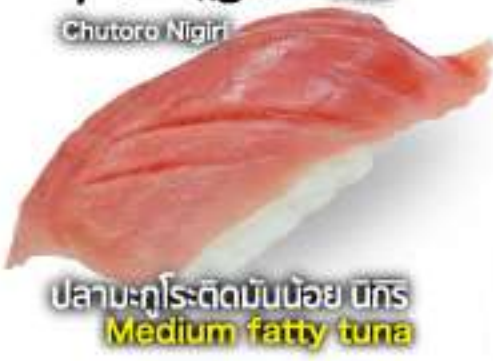
中トロ握り 70B Chutoro Nigiri