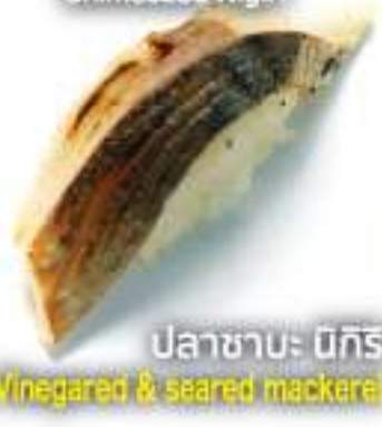
×サバ握り 25B Shimesaba Nigiri