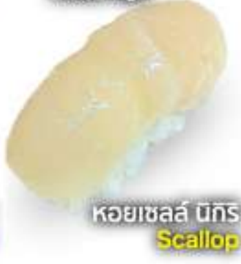
ホタテ握り 60B Hotate Nigiri